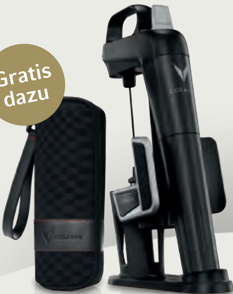
Coravin™ Model 2

1 Coravin™ 1000 mit Standard-Ausschenknel 2 Coravin™-Patronen (Argon-Druckgas) 1 Coravin™-Tragetasche