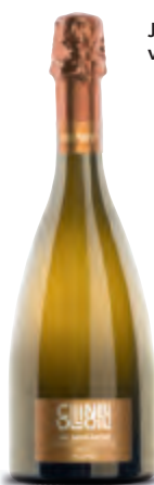
Jahrgangs-Prosecco von Contarini

undenkbar. Hier ist eine abwechslungsreiche Auswahl aus Italien, der Schweiz, Deutschland, Spanien und Frankreich mit ausgezeichnet guter Genuss-Preis-Relation.