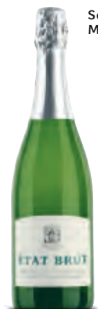
Schweizer Schaumwein, Méthode traditionnelle

49 | Schweiz Etat Brut Méthode traditionnelle Staatskellerei Zürich