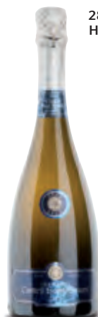
28 Monate Reife auf der Hefe in der Flasche

51 | Spanien Cava DO Gran Brut Castell Sant Antoni