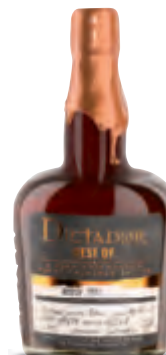
34-jähriger Rhum aus Kolumbien, für Mövenpick abgefüllt

70 | Kolumbien 1981 Rhum Dictador Mövenpick Single Cask Bottling Score 19/20