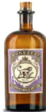
Der Boutique-Gin aus dem Schwarzwald

69 | Deutschland Gin Monkey 47 Schwarzwald Dry Score 18/20